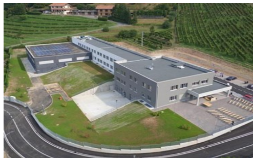
Scuola Secondaria di I Grado di Villa d'Almé "A. Manzi"

Via Monte Bastia, n° 10 (tel. 035 541223) bgic889004@istruzione.it