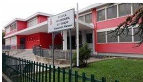
Scuola Secondaria di I Grado di Almé "A. Manzoni"

Via Monte Bastia, n° 10 (tel. 035 541223) bgic889004@istruzione.it